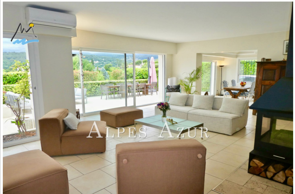
Villa 12956 La Colle-sur-Loup

CHARME et DOUCEUR de VIVRE, au calme absolu nichée dans un cadre de vie préservé et paisible en position dominante en limite du village de VILLENEUVE LOUBET sur la très prisée commune de La COLLE sur LOUP proche des écoles des entrées d'autoroutes et des axes routiers, à 10 mn et des plages, notre agence vous invite à découvrir cette très belle villa néoprovençale de 6 pièces dont 5 de plain pied élégamment rénovée dégagant une ambiance chaleureuse et contemporaine, le terrain clos se partage agréablement en sous bois naturel ombrageant un jeu de boules, en jardin verdoyant pour des jeux et de détente en plein air, en vaste plage dallée entourant une piscine chauffée agrémentée d'un pool house équipé, les intérieurs lumineux bénéficient de larges ouvertures, une vaste pièce de vie intégrant harmonieusement un séjour réchauffé par un poêle à bois prolongé par une salle à manger ouverte sur une cuisine moderne équipée profite d'une superbe terrasse conviviale offrant une vue panoramique et reposante sur la vallée Colloise et la forêt de Montmeuille, 2 chambres dont une suite parentale avec sa salle de bain privée éclairée proposant bain + douche et toilette, la 3ème CHAMBRE avec mezzanine et sa salle