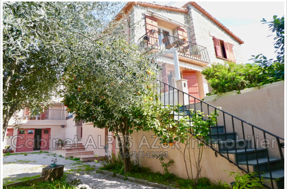
Villa 12440 Cagnes-sur-Mer

BEAUTIFUL FAMILY PROPERTY, quietly located in a dominant position